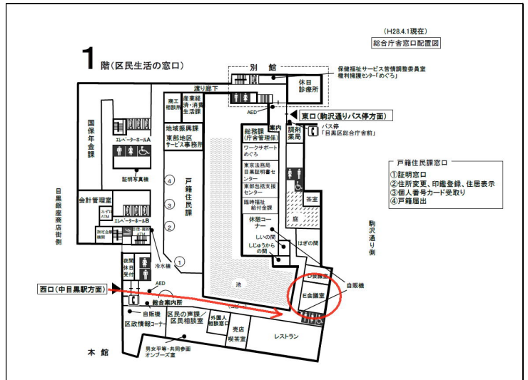
目黒区役所・1階フロア案内(会場: E会議室)