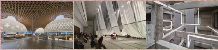
みんなの森ぎふメディアコスモス (伊東豊雄建築設計事務所)