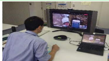
技術者が、カメラ映像を確認し、現場へ指示