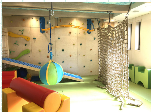
「発達の気になる子のためのプレイルーム」 小さなスペースで、さまざまな「動き」ができるようにレイアウトしている

【主催】 一般社団法人 園Power http://www.en-power.org/ 【お問合せ】 enpower.org@gmail.com 【協力】 合同会社 MichiLab