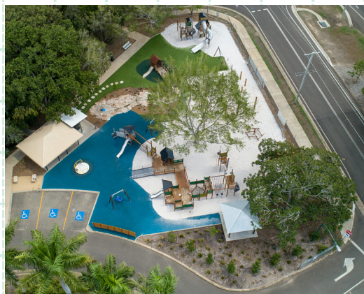
「バンダバーグボタニック植物園の遊び場」 オーストラリアのベストプレイスペースを受賞したHAGS社のインクルーシブ公園

大学で社会福祉を学び、国立総合児童センター「こどもの城」で17年間勤務。閉館後、学童保育指導員/保育士を経て、幼児教育環境作りに携わりたい思いで株式会社アネビーに入社。現在は、発達障がい児にむけた遊び環境を、専門施設はもちろん、幼稚園/保育園/認定こども園に提案している。