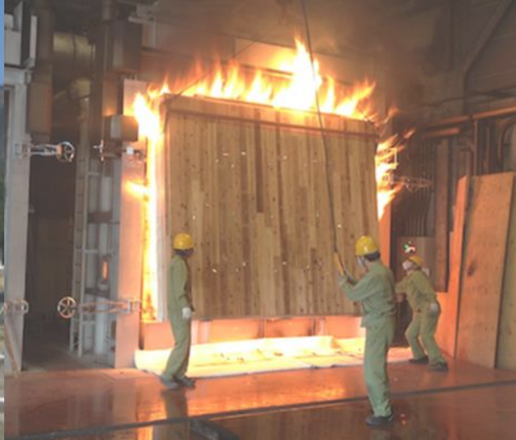
写真左/木造3階建て学校の実大火災実験 右/CLT壁(準耐火構造)の加熱実験