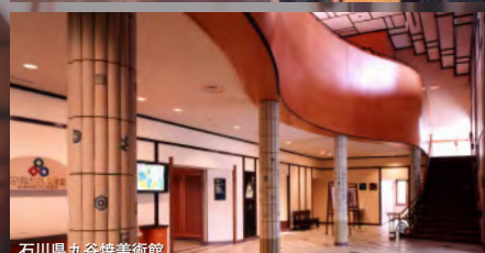
石川県九谷焼美術館