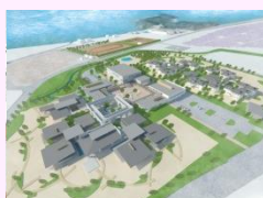
広島型建築プロポーザル (「広島県立広島欽智学園中学校・高等学校」)