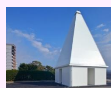
ひろしま建築学生チャレンジコンペ (「御幸松広場トイレ」)