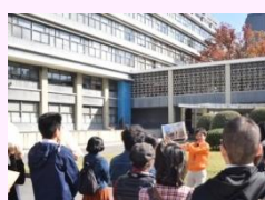
たてものがたりフェスタ (「広島県庁建物見学会」)