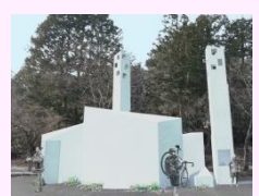
ひろしま建築学生チャレンジコンペ (「広島県立三倉岳自然公園内トイレ」)

[日時] 2018年3月20日(火) から3月26日(月) まで 10:30～20:00 ※初日は13:00から、最終日は13:00まで [会場] 広島ブランドショップ TAU 階段スペース (東京都中央区銀座1-6-10)