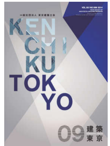
A4版 約30ページ (毎月1回10日発行)