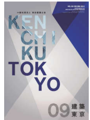
A4版 約30ページ (毎月1回10日発行)